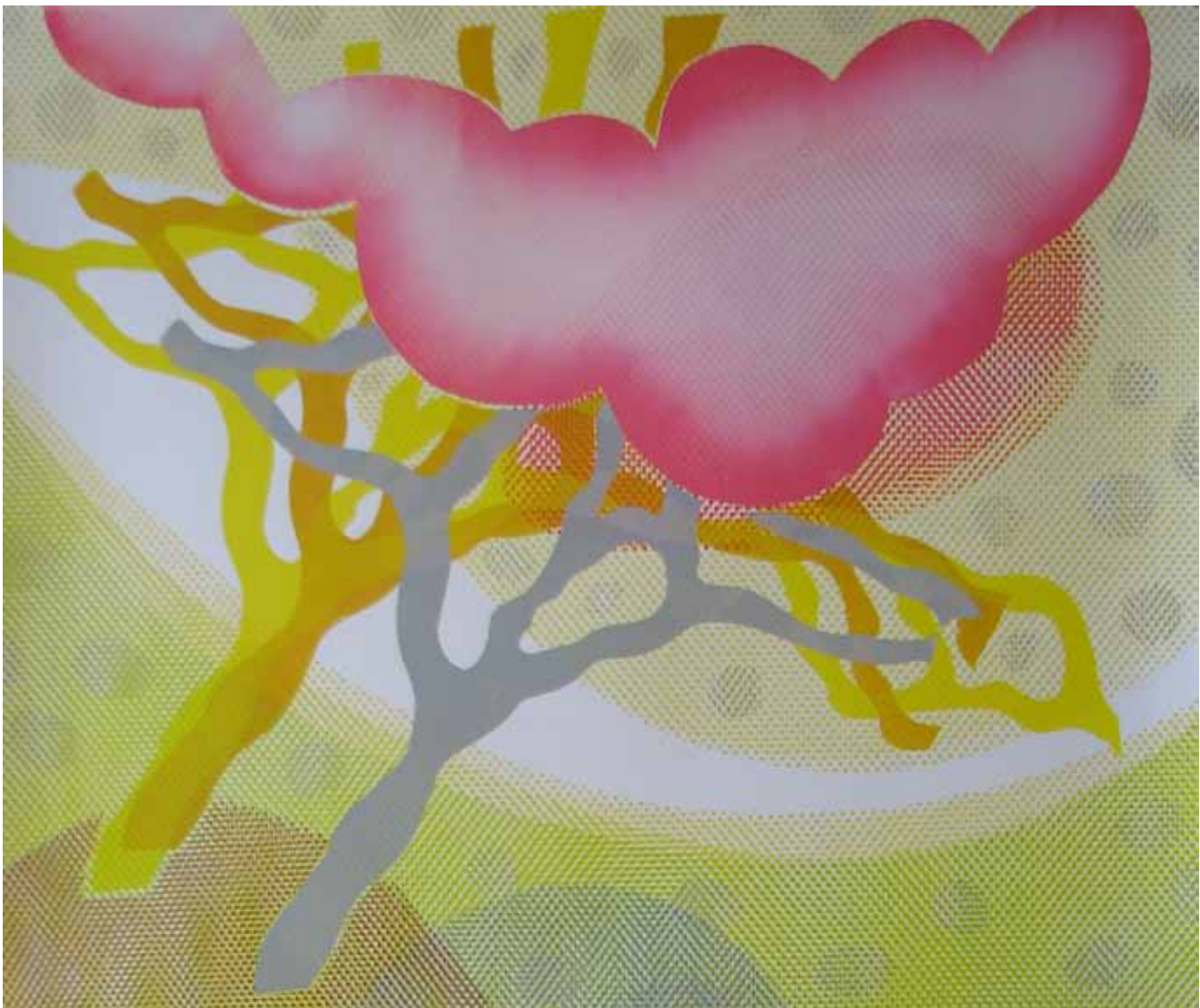
Ruth Roland, fra serien Kart over ømhetens rike , monotypi.