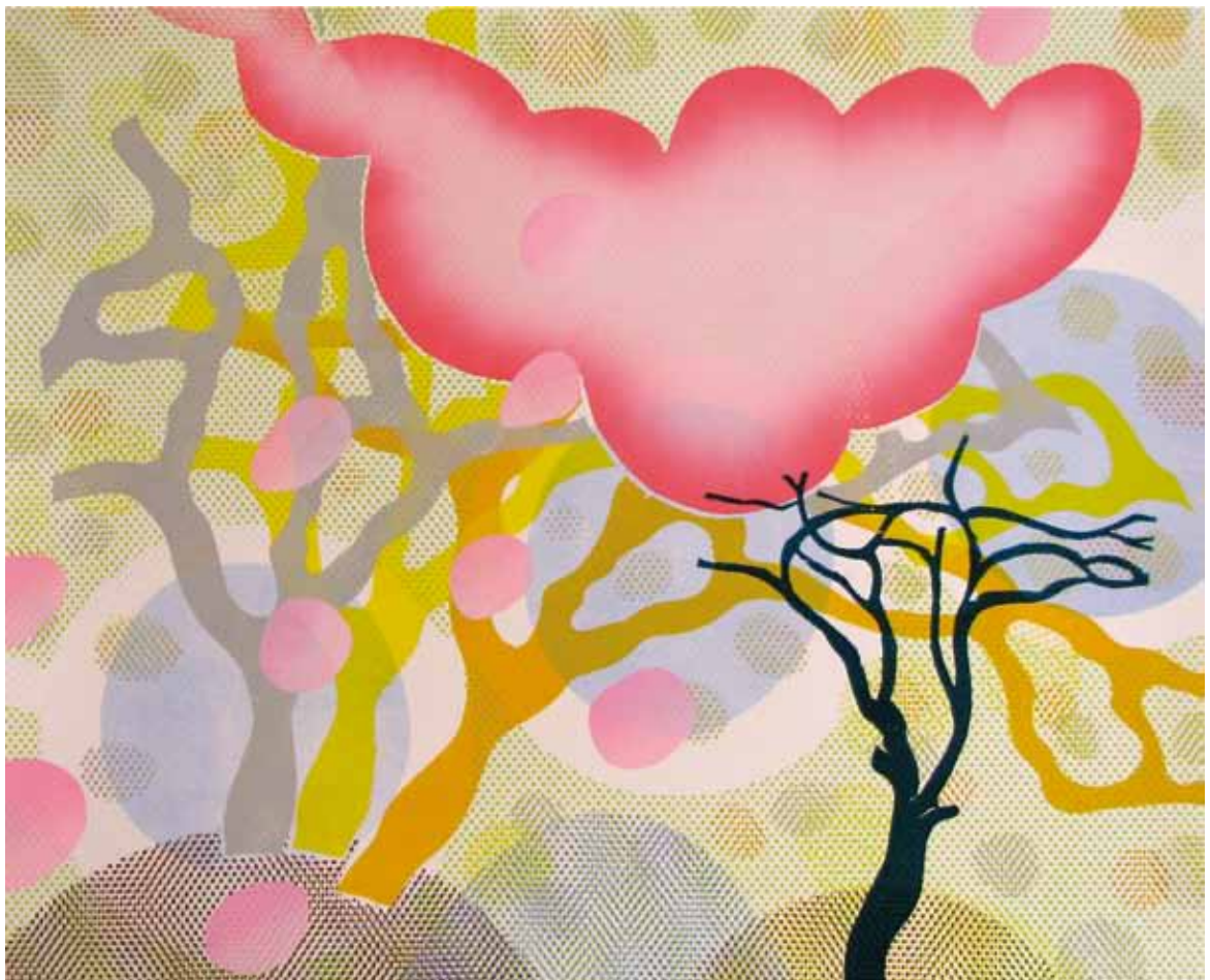
Ruth Roland, fra serien Kart over omhetens rike , monotypi.